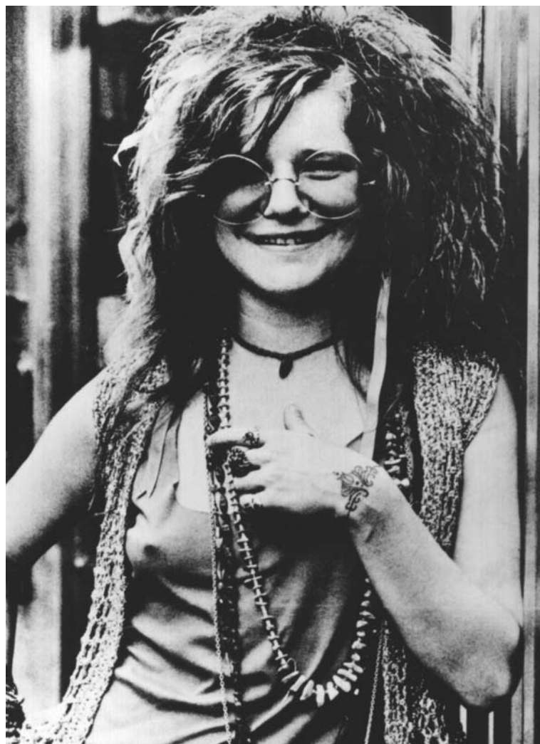
Die US-amerikanische Sängerin Janis Joplin starb am 4. Oktober vor vierzig Jahren an einer Überdosis Heroin.

Für das Rentenalter hätte Janis Joplin aber wahrscheinlich